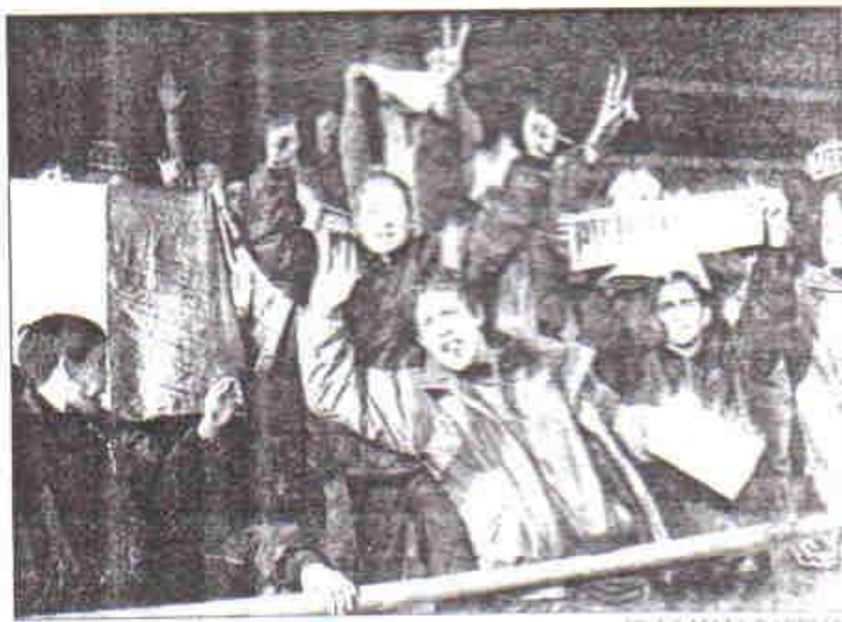
DE LA MATA/BARREDO

MÁS QUE FÚTBOL. Antes de salir los jugadores al terreno de juego, se escuchó la presencia de los objetivos de que se acompañaron de la música. Los jóvenes seguidores del Deportivo León, además de cantar los que llevaban las inscripciones «Bierzo Provincia» y «Frente Norte», festejaron sus deseos de independencia. Ya se sabe que el fútbol es un vehículo ideal para lanzar mensajes de este tipo político.