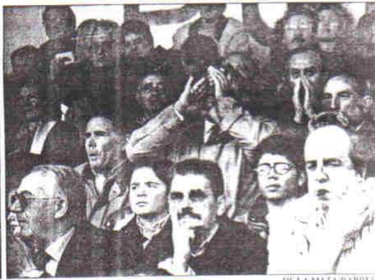
DE LA MATA/BARREDO