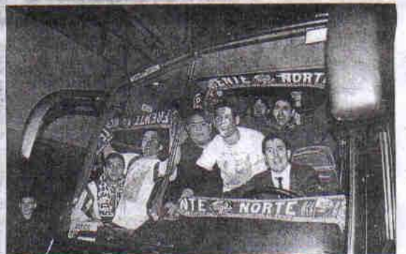
Un autobús de aficionados de la Ponferradina parte del Amilivia.