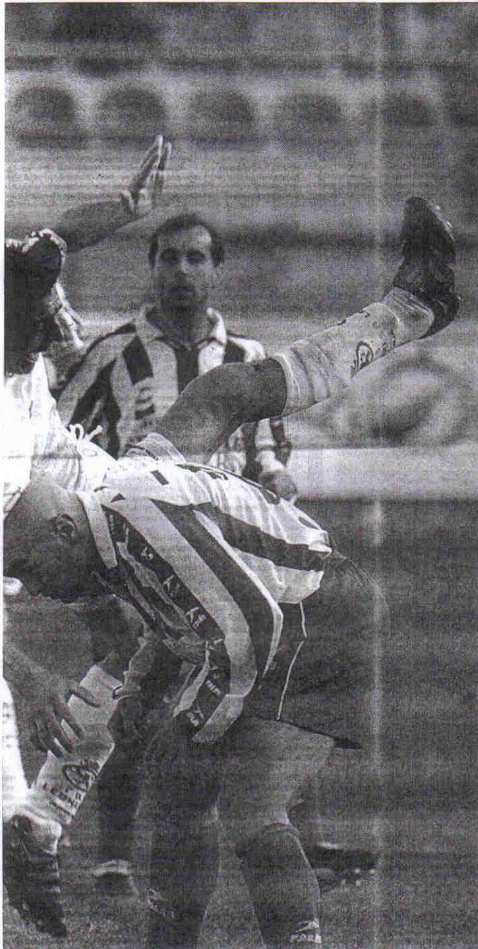
Iaigo en un lance del partido disputado ayer en el Antonio Amilivia.