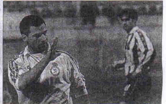
Ibáñez manda un claro mensaje al banquillo barcelonés.