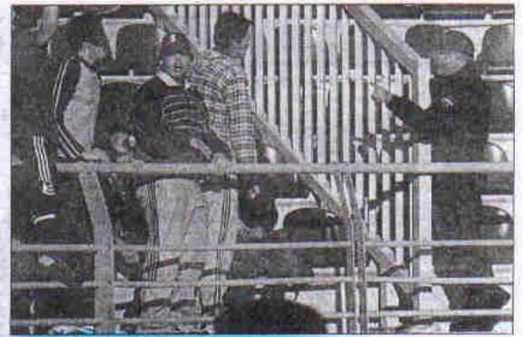
Un policía llama la atención a varios aficionados leoneses.