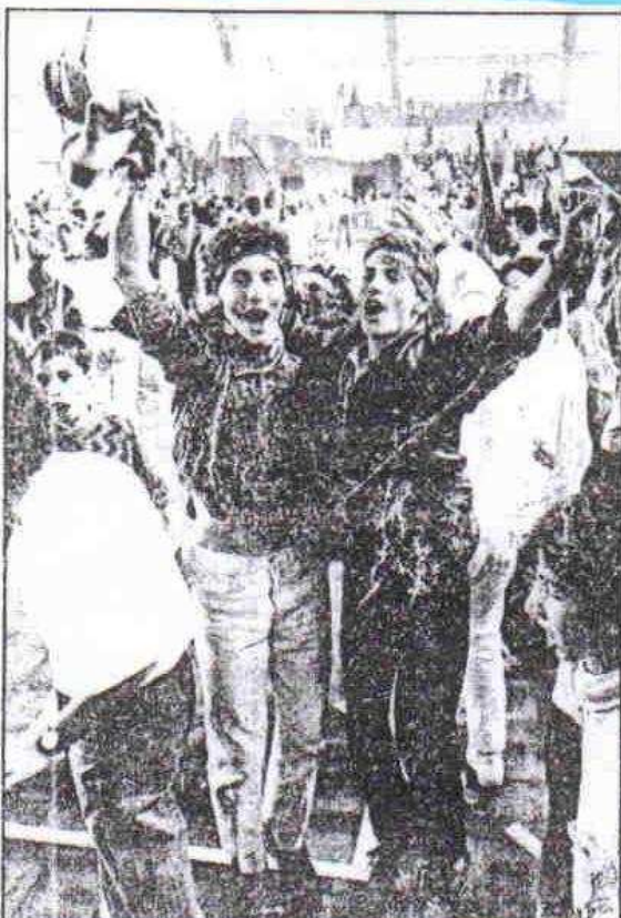
Después de una agónica victoria, los aficionados del Club Baloncesto Elosúa saltaron a la cancha gallega para celebrarlo