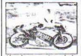
'Aspar' pone en pie a más de 160.000 espectadores con una vibrante victoria en Jerez